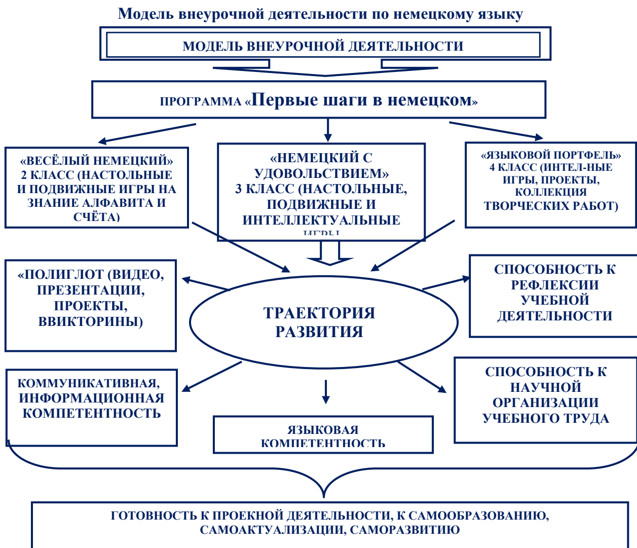
Схема № 1. Модель внеурочной деятельности

Каждое направление включает в себя определённые виды деятельности, соответствующие возрасту, индивидуальным способностям детей, их интеллектуальному развитию.