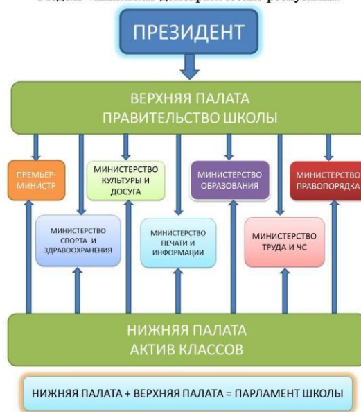
Схема 1. «Модель ученического самоуправления в виде президентской республики»

Воспитательный компонент «ученическое самоуправление» реализуется следующим образом: