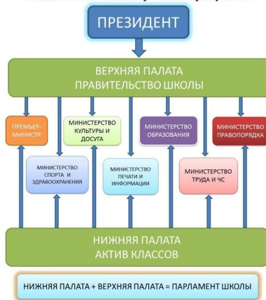
Схема 1. «Модель ученического самоуправления в виде президентской республики»

Воспитательный компонент «ученическое самоуправление» реализуется следующим образом: