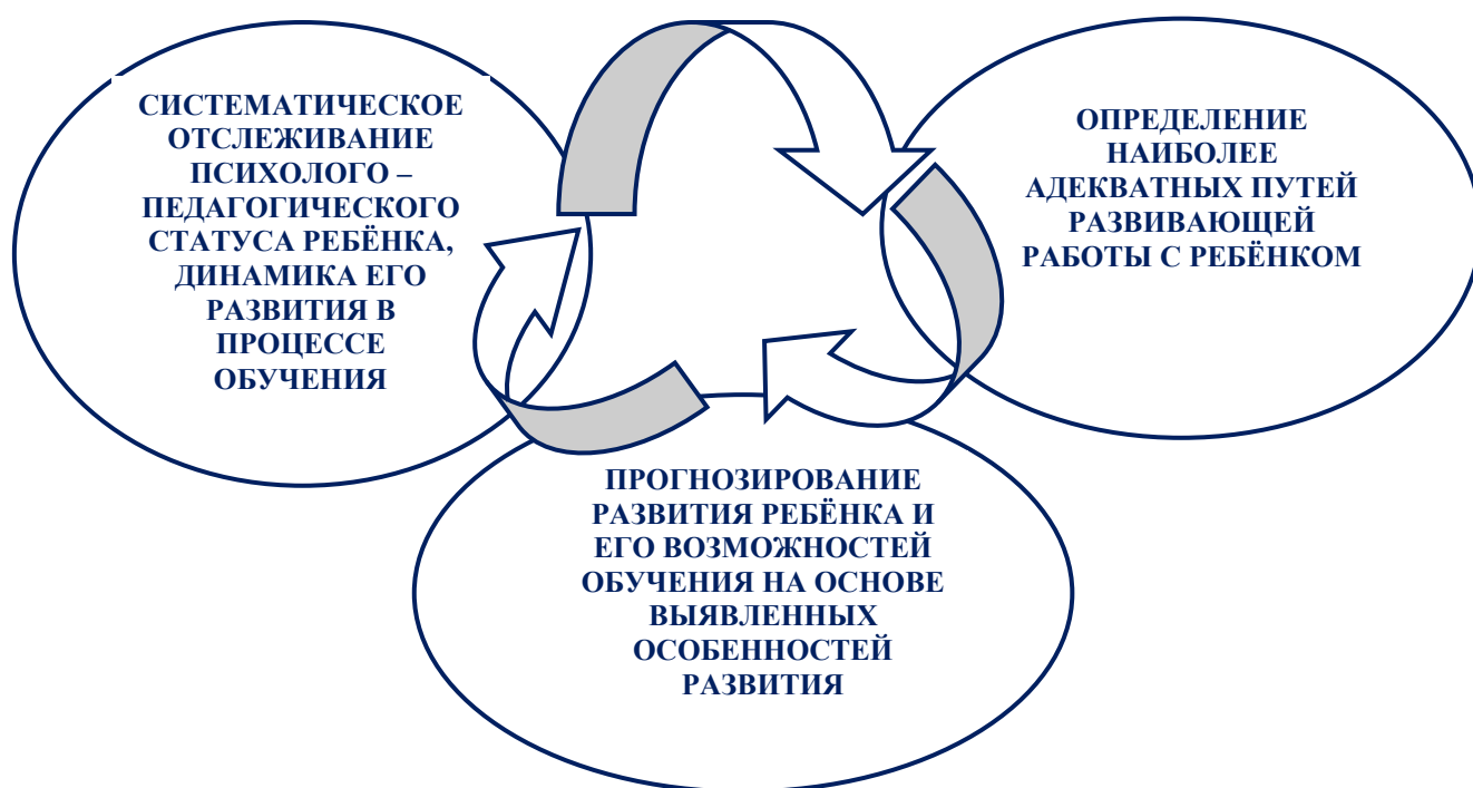
Схема № 3. Задачи сопровождения учащихся